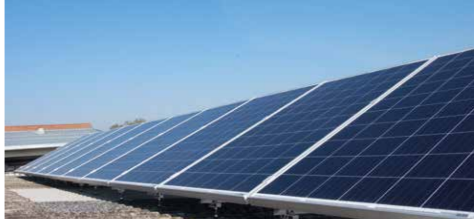
Eine Photovoltaikanlage von DENK – ein Gewinn für Natur, Mitmenschen und die eigene Brieftasche