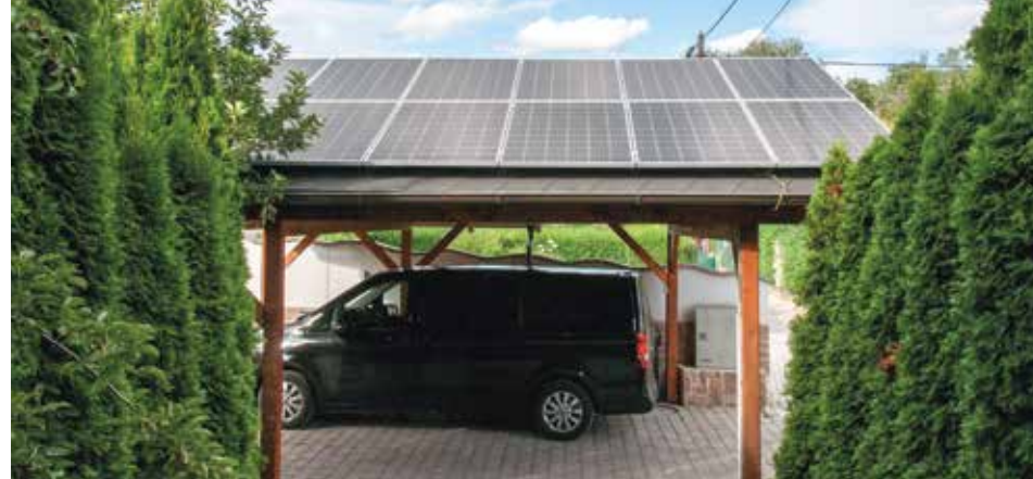
Photovoltaikanlagen für jedes Dach. Egal ob auf dem Carport oder Hausdach – wir bieten Ihnen individuelle Lösungen.