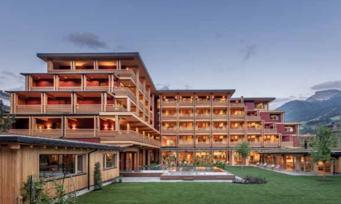
© DasPosthotel GmbH | ZillerSeasons, in 6280 Zell am Ziller

Das fünfstöckige Gebäude ist mehr als nur ein Ankunftsort für Wellnessliebhaber aller Länder. Es ist von Nachhaltigkeit durchdrungen und wurde komplett aus heimischem Holz gebaut.